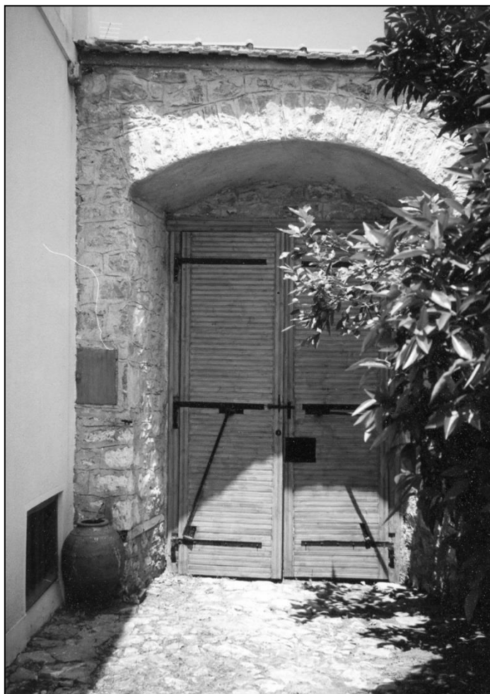
Το εσωτερικό της αulόπορτας σπιτιού στην Πελασγία, Φθιώτιδος

Ρέθυμνον Κομοτινή Σάμος Σέρραι Τρίκαλα Λαμία Φλώρινα Αμφισσα Πολύγυρος Χανιά Χίος